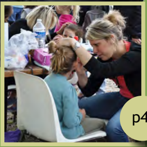
Fête de l'été